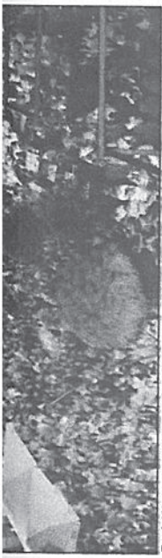
Publika uživala u sjajnoj atmosferi

Pred Harijem su u narednom periodu nastupi u Srbiji pa će već u petak, 14. avgusta, održati koncert u Sjenici, a 22. avgusta pred publikom u Novom Sadu. - Početkom septembra idem u Bugarsku, a poslije toga se vraćam završetku nadolazećeg albuma. Slijedi miksanja pjesama i rad u studiju u Zagrebu i Beogradu - navodi Hari.